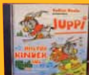
Juppi Kinderhits CD € 12,-