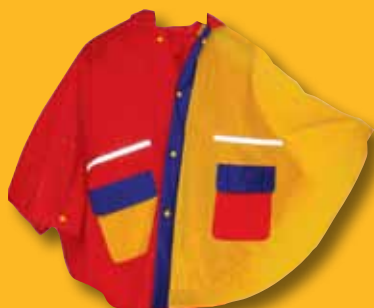
Juppi Regenponcho € 6,90 mit coolem Juppi-Design auf der Rückseite