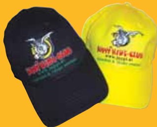
Juppi Baseballmütze € 6,90