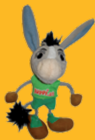
Juppi Schlüsselanhänger € 3,-