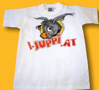
Juppi T-Shirt € 10,- für heiße Sommer-Abenteuer